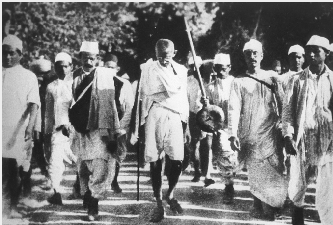
Gandhi tijdens de Zoutmars, 1930

De invloed van de ideeën van Gandhis geweldloze verzet hebben tot de dag van vandaag invloed. In de populaire cultuur wordt er echter zeer selectief en oppervlakkig met de karakter van Gandhi omgesprongen, wat ook heeft geleid tot een karikatuur die de diepgaandere ideeën in zijn filosofie overstemmen.