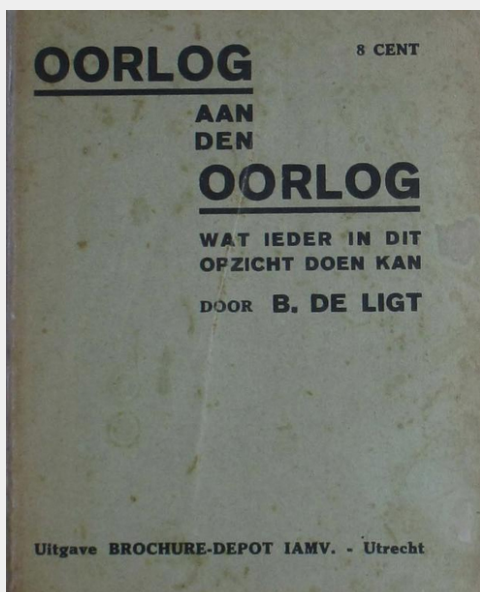
B. de Ligt, Oorlog aan den Oorlog , c.a. 1933

Militarisme betekend dat men de invloed van het leger op de burgerlijke samenleving accepteert of zelfs viert, wat vaak ook gepaard gaat met sterk nationalistische opvattingen. In de samenleving heeft dit uitwerking op de opvatting over hiërarchieën, discipline, het volgen en gehoorzamen van bevelen en ook geslachtsrollen. Het leger vervult binnen het militarisme vaak ook een symbolische rol die het welvaren en de trots van een land weerspiegelt. Dit uit zich in culturele zin door een voorliefde voor militair vertoon, volksliederen, rangen, orden en vlaggen. Het antimilitarisme richt zich juist tegen het gemilitariseerde staatsapparaat en stelt dat deze de vrije geest van de bevolking verstikt.