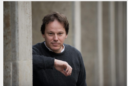
Portret David Graeber

David Graeber (12 February 1961) is een in Londen wonende antropoloog en anarchist die wellicht het bekendst werd met zijn in 2011 verschenen boek Debt: The First 5,000 Years (Nederlandse uitgave Schulden, de eerste 500 jaar , 2012). Hij is momenteel professor in de antropologie aan de London School of Economics . [1]