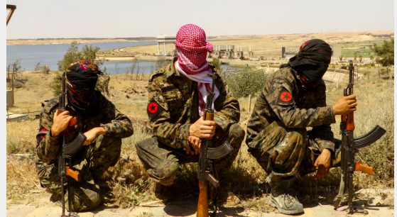
Militanten van de IRPGF in Taqba, Rojava