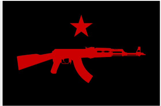
Vlag van de IRPGF

De IRPGF is inmiddels opgeheven. Niet lang daarna werd eind 2017 Tekoşîna Anarşîst (vert. Anarchistische Strijd) opgericht, dat eerst onderdeel was van het IFB maar inmiddels een zelfstandige eenheid binnen de YPG is.