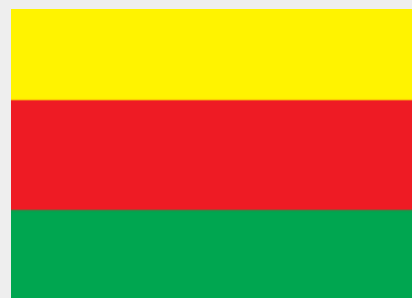
Vlag van 'Rojava' of de Democratische Federatie van Noord-Syrië

Het begrip 'Rojava', Koerdisch voor 'Westen', komt voort uit de verdeling van Koerdistan in 4 gebieden, verspreid over 5 landen: Oost-Turkije (Bakur, noord), Noord-Syrië (Rojava, west), Noord-Irak (Bashur, zuid) en West-Iran (Rojhilat, oost) en een klein stuk van Armenië.