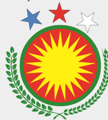
Wapen van 'Rojava'