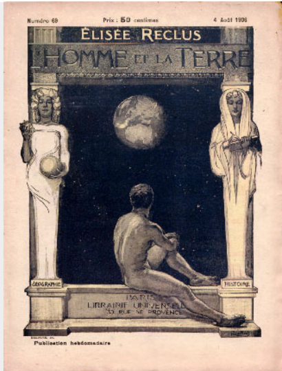
L'Homme et la Terre, 1905

morele en fysiologische reinheid die eruit voortvloeit en hij zette het in het perspectief van een omvattende zienswijze omtrent de geschiedenis en de geografie van culturen.