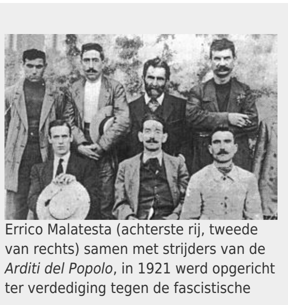
Errico Malatesta (achterste rij, tweede van rechts) samen met strijders van de Arditi del Popolo , in 1921 werd opgericht ter verdediging tegen de fascistische

In 1913 keert Malatesta terug in Italië, geeft daar de Volontà uit in Ancona, maar de uitbraak van de Eerste Wereldoorlog dwingt hem om terug te keren naar Londen. De oorlogsjaren brengen verwarring in de