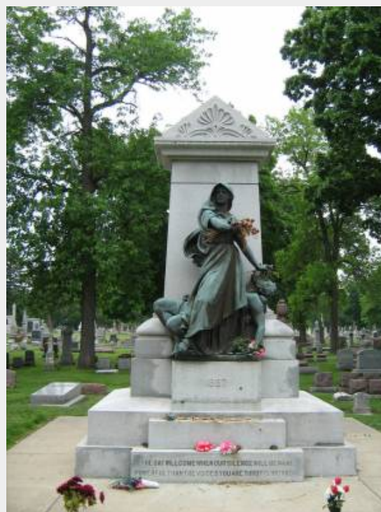
Het monument ter nagedachtenis van de Haymarket martelaren.

Ondanks massaal protest en de vele petitieën kregen slechts twee van de veroordeelden gratie, maar bleven gevangenen. Louis Lingg, een 21-jarige timmerman, bleef zichzelf, één dag voor het ten uitvoering brengen van het vonnis, op in zijn cel. Albert Parsons, een 39-jarige drukker, August Spies, een 31-jarige stoffeerder, Adolph Fischer (28) en George Engel (51) werden op 11 november 1887 opgehangen. Spies' laatste woorden zijn vereeuwigd in het monument dat later opgericht werd ter herdenking van 'de martelaren van Chicago': "De dag zal komen dat ons zwijgen sterker zal zijn dan alle stemmen die vandaag verstikt worden." Enkele dagen later was de begrafenis die door 25.000 mensen bijgewoond werd. Wereldwijd was de verontwaardiging groot. Er waren bijeenkomsten in Nederland en veel andere landen in Europa. In 1893 verscheen er een officiële verklaring waarin het gehele proces veroordeeld werd en de onschuld van de acht beklagden bevestigd werd. [3]