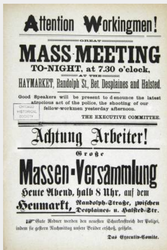
Het pamflet dat oproept tot de stakingsbijeenkomst.

De staking weet de spoorwegen in Chicago volledig lam te leggen en het lukt de stakers bijna de gehele industriële productie van de stad tot stilstand te brengen. Dagelijks worden er betogingen en bijeenkomsten gehouden door werkers en hun sympathisanten. Vrijwel direct na aanvang van de stakingen had zich ook een zogenaamd 'burgercomité' gevormd. Hierin namen grootindustriëlen en de rijke burgerij plaats. Zij zagen hun directe financiële en politieke belangen in het geding komen door de staking en de eisen van de werkers. Het was hun taak om strategieën uit te werken die de staking zouden moeten