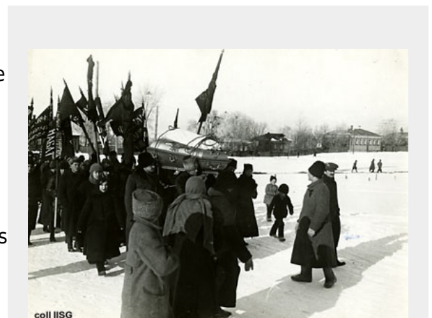
De laatste massademonstratie van anarchisten tijdens de begrafenis van Kropotkin - 13 feb. 1921.

Op 8 februari 1921 stierf hij en op 13 februari vond de begrafenis plaats. Alfred Rosmer, zeker geen kritiekloos bewonderaar van Kropotkin, die namens de Rode Vakverenigings Internationale op het kerkhof sprak, schrijft in Moscou sous Lénine : "De zwarte vlaggen zwaaiden door de lucht en er werden ontroerende liederen gezongen. Op het kerkhof ontstond er een kort maar heftig incident tijdens de eerste redevoeringen. Een Petrogradse anarchist was al enige tijd aan het spreken, toen er gedempte maar verhitte protestuitingen kwamen - 'Davalno! Davalno!' (Genoeg! Genoeg!). Op deze rouwdag wilden Kropotkin's intiemste vrienden niet herinnerd worden aan wat de meeste, zo niet alle anarchisten wel moesten zien als zijn afvalligheid in 1914."