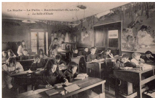
Klaslokaal met leerlingen van de La Ruche-school