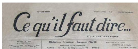
Krantenkop Ce qu'il faut dire , 2 april 1916 (anarchistische krant)