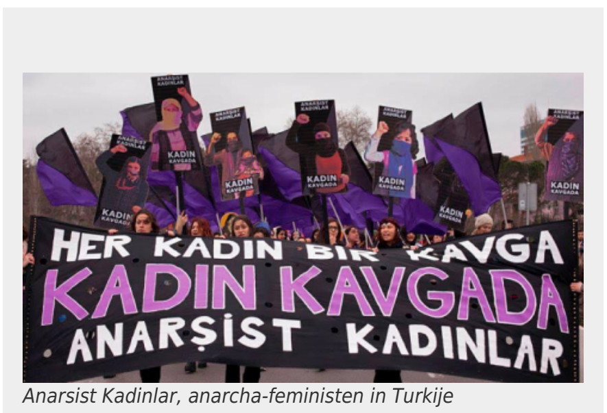
Anarsist Kadınlar, anarcha-feministen in Turkije

Daarnaast staan anarcha-feministes wantrouwig tegenover de hiërarchisch georganiseerde geïnstitutionaliseerde feministische organisaties. Ze geven de voorkeur aan egalitaire grassroots collectieven zoals die in de tweede golf als wortels uit de grond schoten. Deze kleine collectieven die kunnen samenwerken met elkaar in een netwerk, werken met niet-hiërarchische organisatiestructuren – waarop door sommige feministes ook kritiek is gegeven – en zo trachten ze hun idealen van gelijkheid en zusterschap hier en nu in de praktijk te brengen (bv. iedereen evenveel