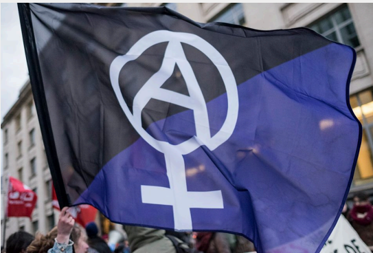
Anarcha-feministische vlag tijdens een demonstratie

was vanaf het begin al duidelijk voor me. Ik heb er nooit vooroordelen over gehad of negatieve connotaties aan verbonden. Natuurlijk is mijn kennis en affiniteit met feminisme ondertussen wel gegroeid, maar het is voor mij altijd heel logisch geweest om mezelf feministe te noemen en het feminisme als iets positiefs te zien. Bij anarchisme lag dat anders. Ik ging er van uit dat anarchisme en anarchie gelijk stond aan chaos en destructie. En daar zag ik niet echt het nut van in. Het was dan ook een beetje verwarrend toen ik zelfverklaarde anarchistes heel leuke projecten zag opstarten zoals volkskeukens, weggeefwinkels, DIY festivals en acties voor een betere wereld. Waarom noemden zij zich anarchist? In de geschiedenisles had ik immers heel andere verhalen gehoord over anarchie dan wat ik om me heen zag. Ik moest mijn ideeën over anarchisme dus heel wat bijschaven en begon me er steeds meer in te vinden.