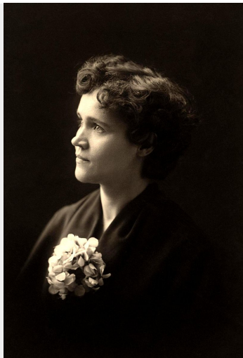
Voltairine de Cleyre.

Een voorbeeld hiervan is Voltairine de Cleyre , die zichzelf eenvoudigweg als 'anarchist' aanduidde en opriep tot het verder aannemen van het anarchisme zonder adjectieven. Zij was van mening dat er op verschillende plekken geëxperimenteerd moest worden om vast te stellen wat de beste organisatorische en economische vorm is die bij het anarchisme past. De Cleyre probeerde in haar artikel Anarchism de verschillende stromingen dichter bij elkaar te brengen en stelde dat vrijheid het uitgangspunt zijn moest: