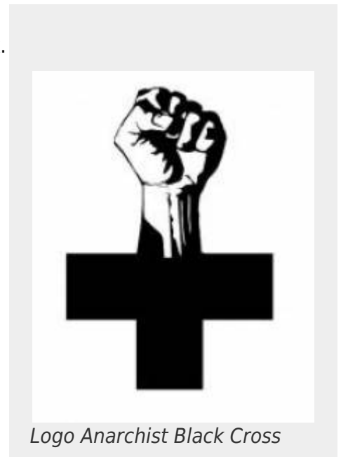
Logo Anarchist Black Cross

Het 'Anarchist Black Cross' (ABC), letterlijk vertaald 'Anarchistisch Zwarte Kruis', is een anarchistisch politiek ondersteuningsnetwerk. Anarchist Black Cross zet zich in voor de ondersteuning van (politieke)gevangenen door hen te voorzien juridische- en materiële (boeken, politieke literatuur, financieel etc.) ondersteuning. Het is een internationaal netwerk dat bestaat uit verschillende autonome groepen die waar mogelijk met elkaar samenwerken. Daarnaast bestaan er in sommige landen koepelorganisaties zoals in de VS.