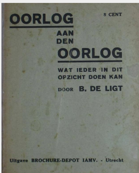
B. de Ligt, Oorlog aan den Oorlog , c.a. 1933

Militarisme betekent dat men de invloed van het leger op de burgerlijke samenleving accepteert of zelfs viert, wat vaak ook gepaard gaat met sterk nationalistische opvattingen. In de samenleving heeft dit uitwerking op de opvatting over hiërarchieën, discipline, het volgen en gehoorzamen van bevelen en ook geslachtsrollen. Het leger vervult binnen het militarisme vaak ook een symbolische rol die het welvaren en de trots van een land weerspiegelt. Dit uit zich in culturele zin door een voorliefde voor militair vertoon, volksliederen, rangen, orden en vlaggen. Het antimilitarisme richt zich juist tegen het gemilitariseerde staatsapparaat en stelt dat deze de vrije geest van de bevolking verstikt.