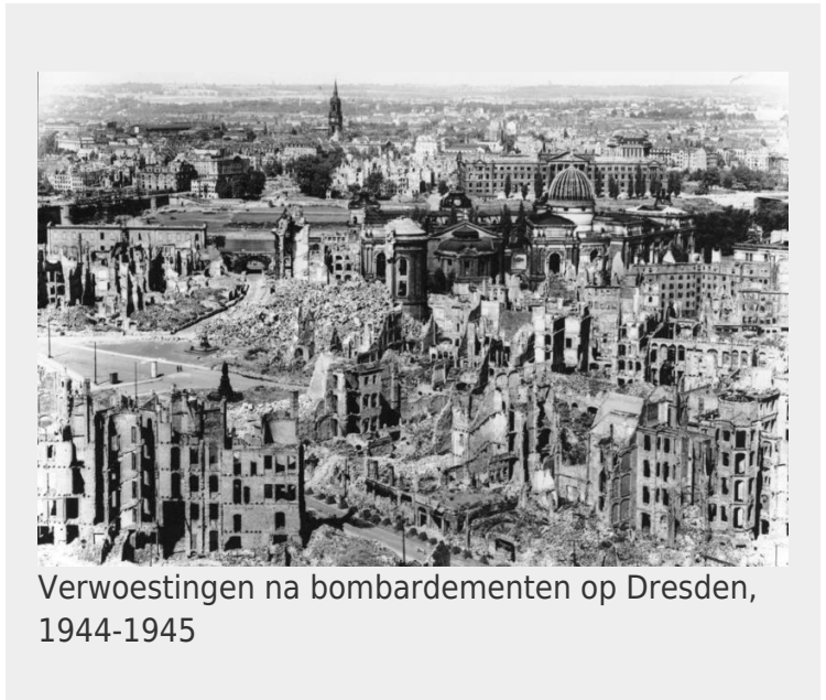
Verwoestingen na bombardementen op Dresden, 1944-1945

In de aanloop naar de Tweede Wereldoorlog waren er verschillende pogingen om zich te verzetten tegen het daarbij eveneens opkomende militarisme. Dit was echter vooral in de landen waar het fascisme en nationaal-socialisme geen werkelijke voet aan de grond hadden. In die landen was namelijk geen tolerantie voor pacifistische opvattingen - deze stonden de nationale belangen in de weg. Alex Comfort (1920-2000) was arts in Groot-Brittannië en een bewuste dienstweigeraar tijdens de oorlog. Hij was actief lid van de Peace Pledge Union (PPU), welke voor de oorlog nog stelde dat als de maatregelen van het Verdrag van Versailles [7] zouden worden teruggedraaid, Nazi-Duitsland diens agressie zou staken. George Orwell, een criticus van het pacifisme, wierp pacifisten voor dat zij "objectief gezien pro-fascistisch" waren door te argumenteren dat "als je de oorlogsinspanningen van de ene partij dwarsboomt, je automatisch die van de andere helpt." [8] Na de annexatie van Sudetenland en de aanval op Tsjecho-Slowakije en Frankrijk zakte het lidmaatschap van de PPU in elkaar. De organisatie veranderde dan ook van stellingname en begon zich vooral te richten op de ondersteuning van dienstweigeraars en verzette zich tegen het bombarderen van civiele doelen in Europa door de geallieerden. Comfort schreef hiervoor in een Britse krant: