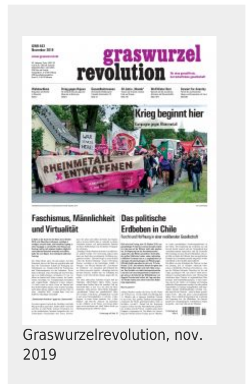
Graswurzelrevolution, nov. 2019

In de Verenigde Staten (VS) is het anarcho-pacifisme eveneens nog altijd sterk vertegenwoordigd. Dit komt doordat het pacifisme daar in het algemeen een grote invloed heeft.