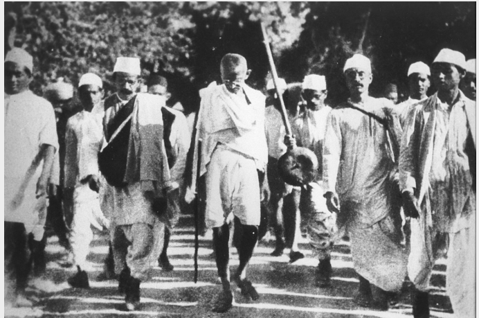
Gandhi tijdens de Zoutmars, 1930

De invloed van de ideeën van Gandhis geweldloze verzet hebben tot de dag van vandaag invloed. In de populaire cultuur wordt er echter zeer selectief en oppervlakkig met de karakter van Gandhi omgesprongen, wat ook heeft geleid tot een karikatuur die de diepgaandere ideeën in zijn filosofie overstemmen.