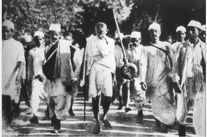
Gandhi tijdens de Zoutmars, 1930

De invloed van de ideeën van Gandhis geweldloze verzet heeft vandaag de dag invloed. In de populaire cultuur wordt er echter zeer selectief en oppervlakkig met de karakter van Gandhi omgesprongen wat ook heeft geleid tot karikatuur die de diepgaandere ideeën in zijn filosofie overstemmen.