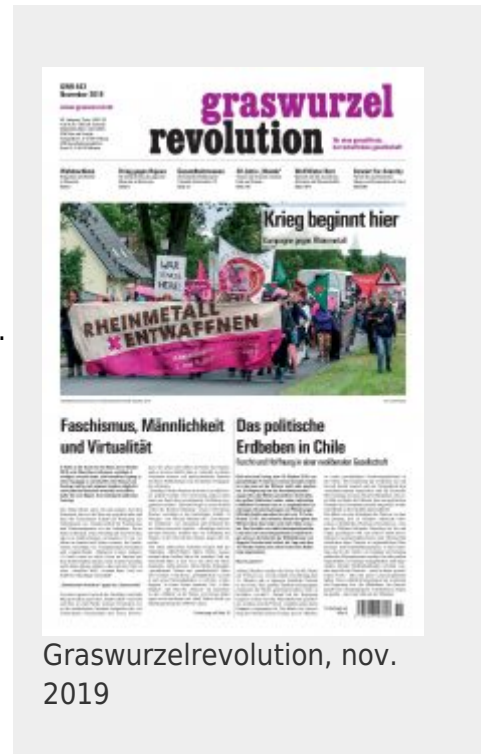
Graswurzelrevolution, nov. 2019

In de Verenigde Staten (VS) is het anarcho-pacifisme nog altijd sterk vertegenwoordigd doordat het pacifisme daar in het algemeen een grote invloed heeft.