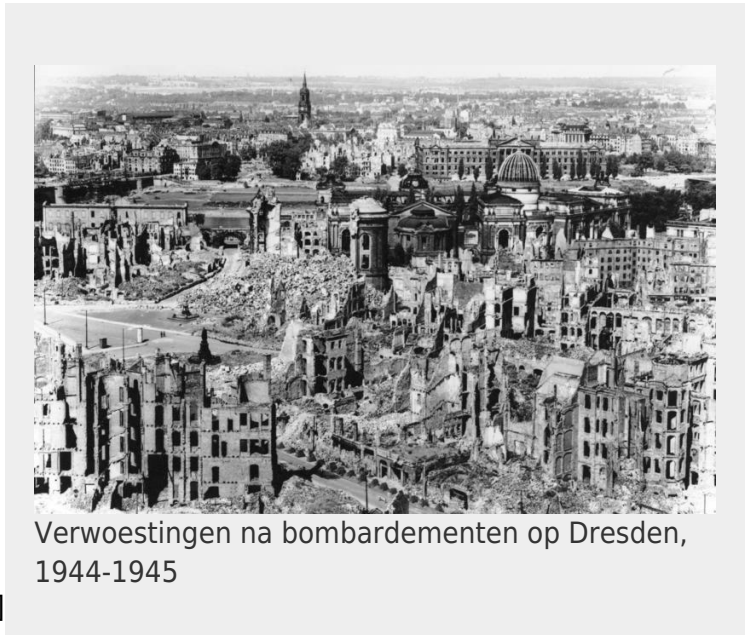
Verwoestingen na bombardementen op Dresden, 1944-1945

De opkomst van het fascisme en de Tweede Wereldoorlog stelde het pacifisme voor een groot dilemma. Er waren in de aanloop naar de oorlog verschillende pogingen om zich te verzetten tegen het daarbij eveneens opkomende militarisme, al was dit vooral in landen waar het fascisme geen werkelijke voet aan de grond had. In die landen was namelijk geen tolerantie voor pacifistische opvattingen - deze zouden de nationale belangen schaden. Alex Comfort (1920-2000) was arts in Groot-Brittannië en een bewuste dienstweigeraar tijdens de oorlog. Hij was actief lid van de Peace Pledge Union (PPU), dat voor de oorlog nog stelde dat als de maatregelen van het Verdrag van Versailles [7] zouden worden teruggedraaid, Nazi-Duitsland diens agressie zou staken. George Orwell, een criticus van het pacifisme, wierp pacifisten voor dat zij "objectief gezien pro-fascistisch" waren door te argumenteren dat "als je de oorlogsinspanningen van de ene partij dwarsboomt, je automatisch die van de andere helpt."[8] Na de annexatie van Sudetenland en de aanval op Tsjecho-Slowakije en Frankrijk zakte het lidmaatschap van de PPU in elkaar. De organisatie veranderde dan ook van stellingname en begon zich vooral te richten op de ondersteuning van dienstweigeraars en verzette zich tegen het bombarderen van civiele doelen in Europa door de geallieerden. Comfort schreef hiervoor in een Britse krant: