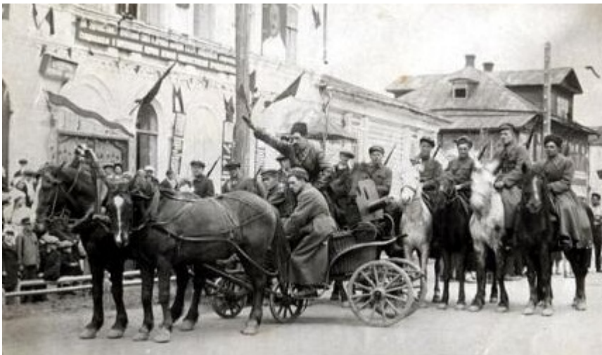
Een tatsjanka en cavalerie van de Makhnovshchina

De Vrije Gevechtseenheid Druzjina was uitgerust met twee kanonnen van zwaar kaliber en een gepantserde platte wagen. De wagons waren geladen met pantserwagens, tatsjanka's en paarden en ook met troepen, wat betekende dat het detachement zich geenszins beperkte tot spoorlijnen. De treinen werden versierd met spandoeken met de teksten "De bevrijding van de arbeiders is de zaak van de arbeiders zelf", "Lang leve de anarchie", "Macht brengt parasieten voort", en "Anarchie is de Moeder van de Orde."