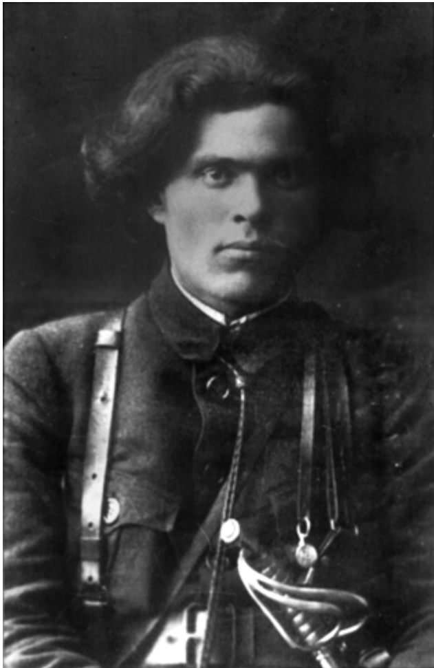
Nestor Makhno in de burgeroorlog, 1919

Uiteindelijk werd Marusja vrijgesproken van alle aanklachten en kreeg de Druzjina haar wapens terug. Marusja en Makhno (ook aanwezig in Taganrog) organiseerden een serie lezingen in het lokale theater en verschillende werkplaatsen over het onderwerp: “De verdediging van de Revolutie - tegen het Oostenrijks-Duitse leger aan het front - tegen de regeringsautoriteiten in het achterste gedeelte.” Het duo gaf ook een folder uit over dit onderwerp.