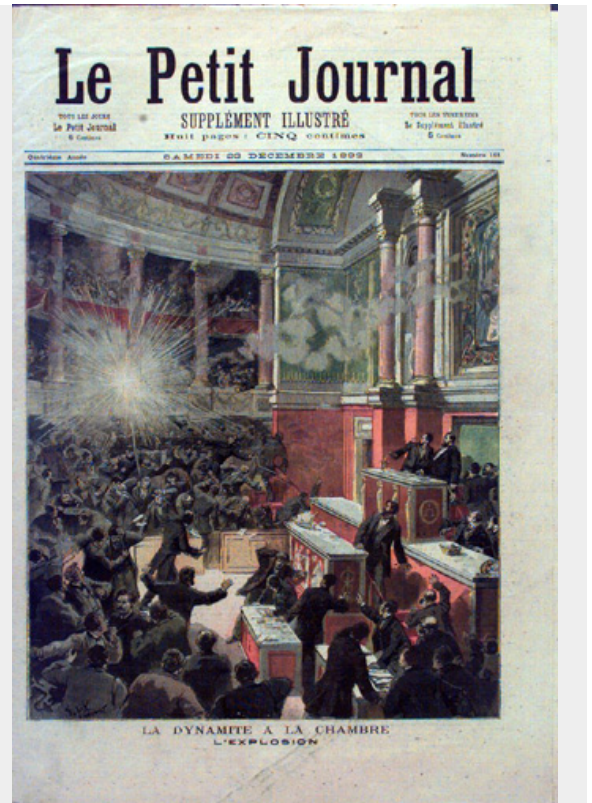
Voorpagina van Le Petite Journal over de aanslag op de Nationale Vergadering .

trok de aandacht, omdat zijn handen met poeder waren bedekt. Het was Auguste Vaillant. Bij ondervraging zei hij dat hij de bom had geworpen, en dat hij de executie van Ravachol had willen wreken.