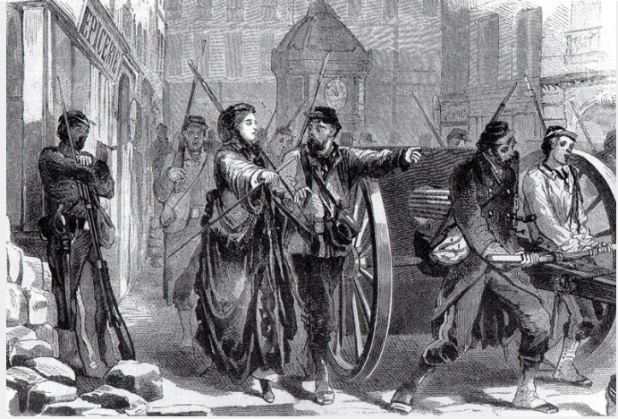
De bevolking positioneert de nieuw veroverde kanonnen

Maar de nationale gardes, die de wacht optrokken bij de kanonnen, sloegen alarm zodat na een korte tijd, niet alleen de nationale wacht te wapen liep, maar ook de burgerbevolking op straat kwam. Dit laatste gaf hier en daar aanleiding tot verbroedering tussen troepen en burgers. En twee generaals van Thiers werden gevangen genomen en iets later - ondanks de tussenkomst van leden der nationale wacht - door de woedende bevolking vermoord. De toestand evolueerde ondertussen zo snel dat de nationale regering niet alleen besloot zich uit de hoofdstad terug te trekken, maar ook haar leger beval zich in Versailles te hergroeperen.