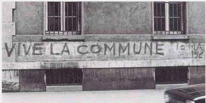
Referentie naar de Commune op de muren van Parijs, 1968