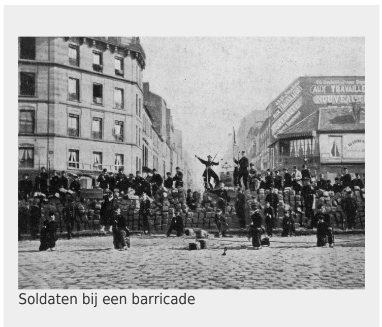
Soldaten bij een barricade

Tot 24 april uitten de vijandelijkheden zich door korte schermutselingen, en hevige beschietingen. Voor 21 mei wist het leger van