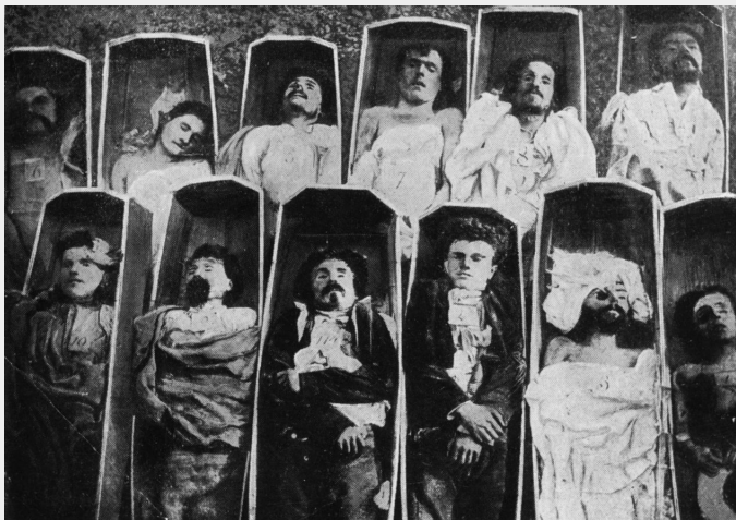
Slachtoffers van de terreur van de Franse staat