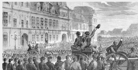
Proclamatie van de Commune van Parijs, 1871, Hotel de Ville Lamy.

De Frans-Duitse oorlog van 1870-1871 eindigde met de capitulatie van de Franse troepen (2 september 1870) en de uitroeping van de derde republiek (4 september 1870). Maar Parijs werd daarna door Duitse troepen omsingeld en belegerd. Vanaf 5 januari 1871 bombardeerden de Pruisische kanonnen de stad en op 29 januari werd de wapenstilstand te Versailles getekend. De bevolking van Parijs verzette zich echter tegen deze capitulatie, greep de wapens en groef zich in. Op dat moment kreeg ook de politieke administratie van Parijs voor korte tijd een radicale wending.