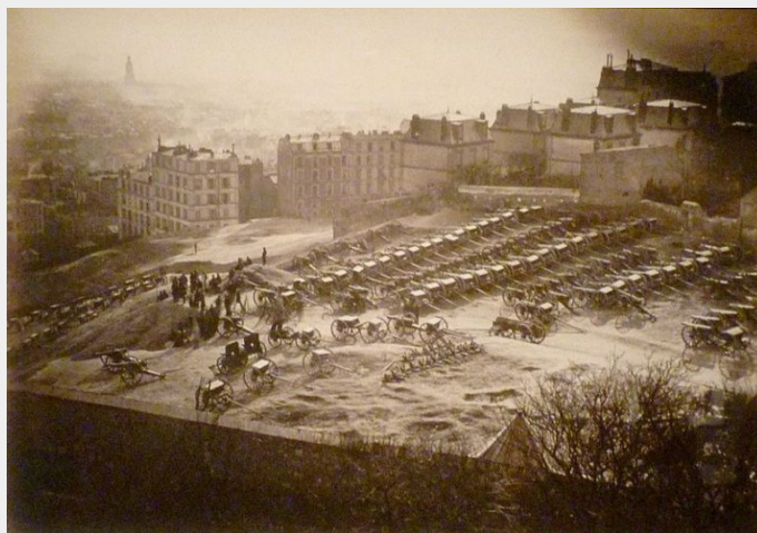
Kanonnen op Montmartre

Op 8 februari werd een nationale vergadering gekozen die, onder leiding van Adolphe Thiers eerst te Bordeaux en vervolgens in Versailles samenkwam. Samengesteld uit een meerderheid van monarchisten beijverde deze vergadering zich om tot elke prijs een vrede met Duitsland te sluiten om daarna des te gemakkelijker met de republikeinse en links georiënteerde hoofdstad te kunnen afrekenen. Als gevolg van deze situatie heerste er te Parijs een algemene ontevredenheid bij de kleine burgerij en het proletariaat, die niet alleen vreesden dat de Republiek maar ook de democratie in het gedrang zouden komen. En hun vrees werd realiteit: op 11 maart decreeteerde men bijvoorbeeld de opheffing van 6 republikeinse kranten, onder meer Le Pere Duchène en Le Cri du Peuple . En in de nacht van 17 op 18 maart gaf Thiers het bevel de kanonnen van de nationale wacht in beslag te nemen. In de vroege ochtend bezetten verschillende legereenheden de hun aangewezen posities. Het uiteindelijke doel van Thiers was een militaire bezetting van de hoofdstad, terwijl hij tevens de groeiende invloed van het centrale comité der nationale