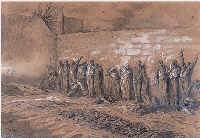
Executie van communards Pere Lachaise

Achter deze hoge, maar dode cijfers schuilt dikwijls een wrede werkelijkheid. Officieren, bijgestaan door politie-commissarissen beslisten na een summiere ondervraging, of zelfs alleen maar bij het