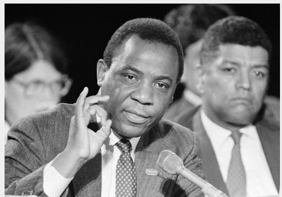
Zwarte burgermeester Wilson Goode overzag het politiebombardement op de zwarte radicale groepering 'MOVE' in 1985

Tegen het midden van de jaren zeventig was de zwarte bevrijdingsbeweging grotendeels verslagen. De opstanden waren met gewapend geweld neergeslagen, en de revolutionairen waren dood of gevangen genomen. Het kapitalisme van de V.S. nam hervormingen aan om de stoom uit de beweging te halen. In steden in de hele V.S. werden zwarte burgemeesters gekozen. Nieuwe carrières openden zich voor zwarte vakmensen. Er waren altijd al zwarte bedrijfseigenaren en mensen uit de middenklasse geweest. Maar wettelijke segregatie en geweld van de witten maffia weerhielden hen ervan samen te leven met, en dienstbaar te zijn aan, de zwarte arbeidersklasse. Nu werden veel van de wettelijke en sociale barrières die de zwarte bourgeoisie en middenklasse tegenhielden weggenomen. Ze stegen snel sociaal en economisch, en lieten de zwarte armen achter zich.