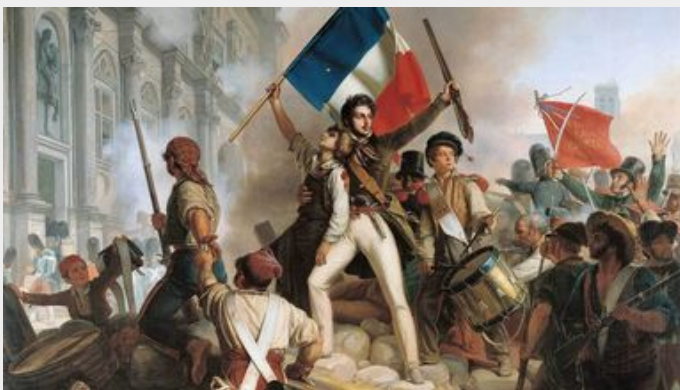
volutie duurde van 1787 tot 1799

Spoedig vingen honderden kleine groepen denkers en activisten de geest van de Verlichting op. De Orde van Illuministen was maar één zo'n groep, naast andere zoals de Rozenkruisers en de Italiaanse Carbonari. In de loop van de jaren 1780 groeiden de Illuministen tot zo'n 2.500 leden in Midden-Europa. Maar ze waren niet erg succesvol in het omverwerpen van de middeleeuwse orde, en kregen al gauw te maken met repressie van de autoriteiten. Ze ontbonden zich rond 1787. Zoals zovele andere groepen van hun soort slaagden de Illuministen er niet in revolutionaire veranderingen teweeg te brengen.