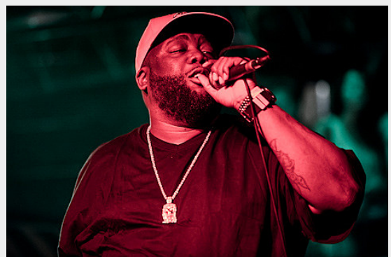
Na de moord op Tryvon Martin in 2012 riep Killer Mike zwarte mensen op zich te bewapenen in geval van een milieucrisis of het einde van de Maya-kalender.