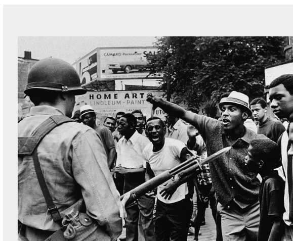
Newark rellen, juli 1967

Op het hoogtepunt van de opstanden in de jaren '60 kwamen miljoenen zwarte mensen in opstand tegen het kapitalisme van de V.S.. De opstanden waren enorm: in de zomers tussen 1965 en 1968 beleefde elke grote stad in het land een opstand. Mensen plunderden goederen en deelden die gratis uit. Ze overvielen wapenmagazijnen van de Nationale Garde en vochten in de straten tegen de politie. Naarmate de strijd zich ontwikkelde, begonnen miljoenen mensen zich af te vragen waarom zwarte mensen onderdrukking en uitbuiting ervoeren, en wie de vijanden waren.