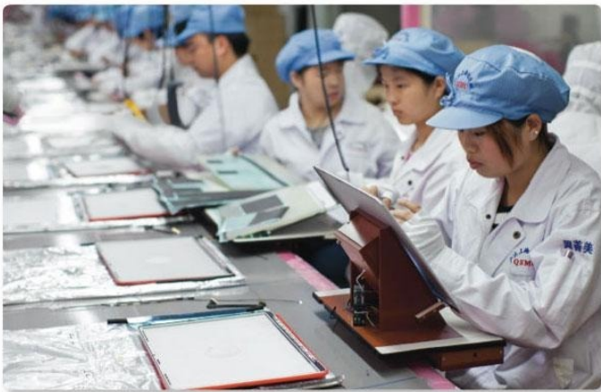
De wereld voorraad van Apples Ipads worden vervaardigd in fabriekscomplexen in China.

De beste manier om onderdrukking en uitbuiting te verklaren is via een theorie van het kapitalistische systeem als geheel, niet via de theorie van de Illuminati. Een theorie van het kapitalisme verklaart hoe onderdrukking en uitbuiting gebeuren als gevolg van de dagelijkse werking van een *geheel sociaal systeem*. De activiteiten en interacties van miljoenen mensen houden de maatschappij draaiende, dag na dag, en creëren daarbij ook onderdrukking en uitbuiting. Door uit te leggen hoe dit systeem werkt, kunnen we uitzoeken hoe we het kunnen stoppen en iets nieuws kunnen creëren. We kunnen ook zien hoe de Illuminati-theorie niet inziet hoe ons kapitalistisch sociaal systeem werkt, en in plaats daarvan de slechte shit die we meemaken wijt aan een enkele groep mensen, zoals vrijmetselaars, joden of bankiers.