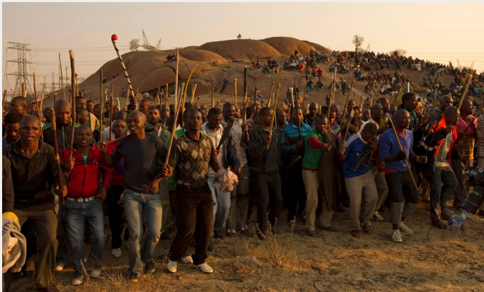
Platinamijnwerkers in Marikana, Zuid-Afrika staken voor hogere lonen in 2012. Ze verzetten zich tegen de repressie van de politie, wat een nationale crisis ontketende.

Het *Communisme* is de beweging van de arbeidersklasse en de onderdrukten, die het kapitalistische systeem omver wil werpen en een vrije samenleving tot stand wil brengen. Al honderden jaren proberen arme mensen en mensen uit de arbeidersklasse een eind te maken aan kapitalisme, kapitaal, witte suprematie, patriërchaat, nationalisme, homofobie, en imperialisme. Deze geschiedenis heeft een lange lijst van organisaties, bewegingen en ideeën opgeleverd waar wij van kunnen leren. Communisme is de theorie die getrokken wordt uit de strijd van de onderdrukten om hun eigen ketenen te breken. Het kan ons helpen een beter soort samenleving te bereiken. Het groeit en verandert voortdurend met elke nieuwe strijd die opkomt.