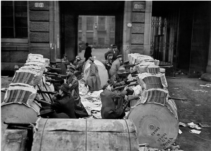
Militante arbeiders doen een poging tot een revolutie in Berlijn, Duitsland, januari 1919.

veranderen. In 1926 publiceerde Nesta Webster, een Engelse aristocrate, *Secret Societies and Subversive Movements, The Need for Fascism in Great Britain* . Lady Queenborough (ook bekend als Edith Starr Miller), de dochter van een industrieel kapitalist uit de V.S., publiceerde *Occult Theocracy* in 1933. Beide schrijvers betoogden dat de revolutionaire vurigheid die de wereld overspoelde veroorzaakt werd door een geheime samenzwering. Beiden combineerden de oude Illuminati-theorie met nieuwe elementen.