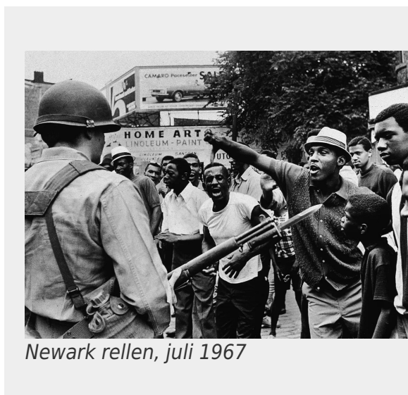
Newark rellen, juli 1967

Op het hoogtepunt van de opstanden in de jaren '60 kwamen miljoenen zwarte mensen in opstand tegen het kapitalisme van de V.S.. De opstanden waren enorm: in de zomers tussen 1965 en 1968 beleefde elke grote stad in het land een opstand. Mensen plunderden goederen en deelden die gratis uit. Ze overvielen wapenmagazijnen van de Nationale Garde en vochten in de straten tegen de politie. Naarmate de strijd zich ontwikkelde, begonnen miljoenen mensen zich af te vragen waarom zwarte mensen onderdrukking en uitbuiting ervoeren, en wie de vijanden waren.