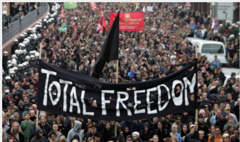
Demonstratie in Hamburg, Duitsland tegen de Asia-Europe Top, mei 2007.

Communisme is de vernietiging van kapitaal, witte suprematie, vrouwenonderdrukking, lesbische/homo/biseksuele/transgender onderdrukking, imperialisme, milieuvernietiging, en nog veel meer. Miljarden armen en mensen uit de arbeidersklasse zullen dat bereiken door middel van stakingen, rellen, gewapende gevechten, en massabijeenkomsten tegen het systeem. Het zal niet gebeuren door een kleine groep "verlichte" mensen. Het zal gebeuren - zoals elke revolutie in het verleden - door een massabeweging tegen de onderdrukking.