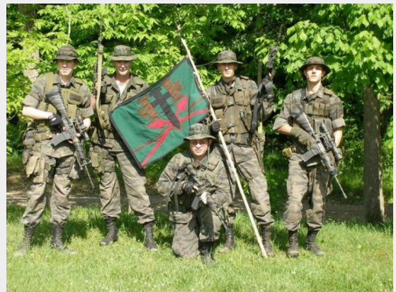
In 2010 deden federale agenten een inval bij de Hutaree-militie in Michigan, een gewapende groep die zich voorbereidde op een strijd tegen 'de antichrist'.

De illuminati-theorie is nog maar een voorbeeld van deze vreemde overlapping. In de Illuminati-theorieën zien arme mensen in achterstandswijken banken en de politieke elite als hun vijand, en ze zijn geneigd "zwarte bedrijven" te omarmen als een manier om de gemeenschap te verheffen, net als de black power beweging van de jaren '60. Witte conservatieven gebruiken de Illuminati-theorie om dezelfde vijanden