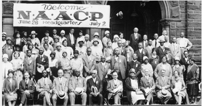
De "New Negro" beweging ontstond na de Eerste Wereldoorlog, toen zwarte veteranen, veranderd door hun ervaringen in de oorlog zich begonnen te verzetten tegen de Jim Crow-segregatie.

Historisch gezien zijn de ideeën van mensen veranderd in perioden van immense crisis, door allerlei factoren, en niet alleen omdat ze het juiste argument hoorden. Het belangrijkste is dat ze veranderd zijn naarmate mensen door de hitte van de strijd leerden. Mensen veranderen door onze ervaringen in de strijd, niet door alleen maar te luisteren naar wat anderen te zeggen hebben. Naarmate meer en meer mensen beginnen te strijden, van Tahrir Square, tot Occupy, tot de Flatbush Rebellion, beginnen we te beseffen dat we een collectieve kracht hebben waar niemand ons over heeft durven vertellen. Dan staan we open voor nieuwe ideeën, terwijl we dat eerder niet waren.