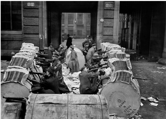
Militante arbeiders doen een poging tot een revolutie in Berlijn, Duitsland, januari 1919.

hen niet konden verklaren, wendden de moderne kapitalisten zich tot Illuminati-theorieën. Ze dachten niet dat arbeiders slim genoeg waren om de wereld werkelijk te veranderen. In 1926 publiceerde Nesta Webster, een Engelse aristocrate, *Secret Societies and Subversive Movements, The Need for Fascism in Great Britain* . Lady Queenborough (ook bekend als Edith Starr Miller), de dochter van een industrieel kapitalist uit de V.S., publiceerde *Occult Theocracy* in 1933. Beide schrijvers betoogden dat de revolutionaire vurigheid die de wereld overspoelde veroorzaakt werd door een geheime samenzwering. Beiden combineerden de oude Illuminati-theorie met nieuwe elementen.