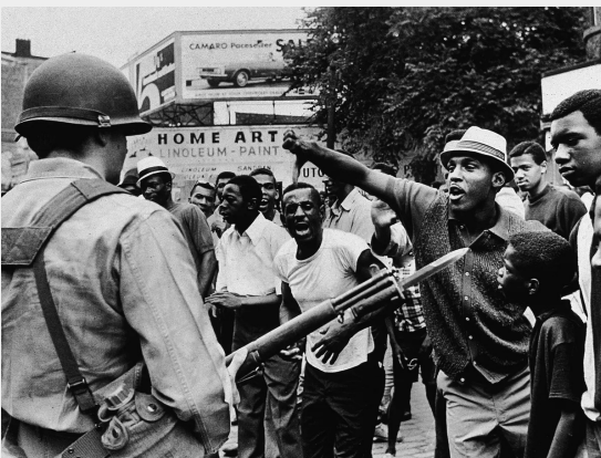
Newark rellen, juli 1967

Op het hoogtepunt van de opstanden in de jaren '60 kwamen miljoenen zwarte mensen in opstand tegen het kapitalisme van de V.S.. De opstanden waren enorm: in de zomers tussen 1965 en 1968 beleefde elke grote stad in het land een opstand. Mensen plunderden goederen en deelden die gratis uit. Ze overvielen wapenmagazijnen van de Nationale Garde en vochten in de straten tegen de politie. Naarmate de strijd zich ontwikkelde, begonnen miljoenen mensen zich af te vragen waarom zwarte mensen onderdrukking en uitbuiting ervoeren, en wie de vijanden waren.