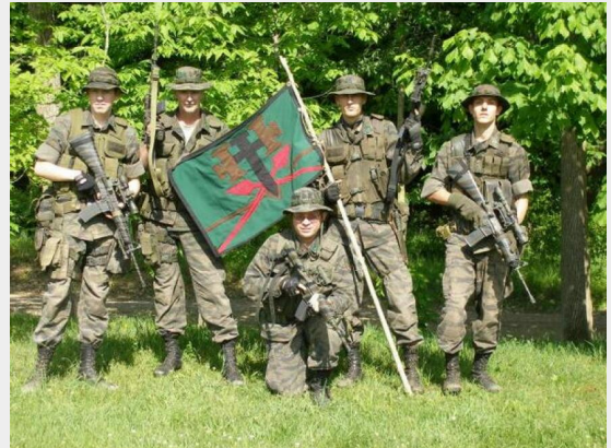
In 2010 deden federale agenten een inval bij de Hutaree-militie in Michigan, een gewapende groep die zich voorbereidde op een strijd tegen 'de antichrist'.

De Illuminati-theorie levert hetzelfde gevaar op als witte supremacistische en zwarte nationalistische theorieën. Ze zal de neiging hebben populistische bewegingen te steunen die arme witte mensen en arme zwarte mensen verenigen met hun respectieve heersende elites, in plaats van een beweging op