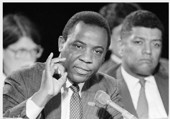
Zwarte burgermeester Wilson Goode overzag het politiebombardement op de zwarte radicale groepering 'MOVE' in 1985

Tegen het midden van de jaren zeventig was de zwarte bevrijdingsbeweging grotendeels verslagen. De opstanden waren met gewapend geweld neergeslagen, en de revolutionairen waren dood of gevangen genomen. Het kapitalisme van de V.S. nam hervormingen aan om de stoom uit de beweging te halen. In steden in de hele V.S. werden zwarte burgemeesters gekozen. Nieuwe carrières openden zich voor zwarte vakmensen. Er waren altijd al zwarte bedrijfseigenaren en mensen uit de middenklasse geweest. Maar wettelijke segregatie en geweld van de witten maffia weerhielden hen ervan samen te leven met, en dienstbaar te zijn aan, de zwarte arbeidersklasse. Nu werden veel van de wettelijke en sociale barrières die de zwarte bourgeoisie en middenklasse tegenhielden weggenomen. Ze stegen snel sociaal en economisch, en lieten de zwarte armen achter zich.