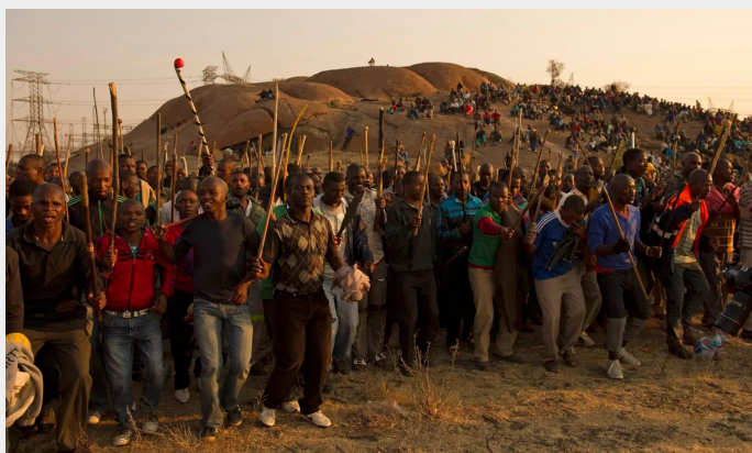
Platinamijnwerkers in Marikana, Zuid-Afrika staken voor hogere lonen in 2012. Ze verzetten zich tegen de repressie van de politie, wat een nationale crisis ontketende.

Het *Communisme* is de beweging van de arbeidersklasse en de onderdrukten, die het kapitalistische systeem omver wil werpen en een vrije samenleving tot stand wil brengen. Al honderden jaren proberen arme mensen en mensen uit de arbeidersklasse een eind te maken aan kapitalisme, kapitaal, witte suprematie, patriërchaat, nationalisme, homofobie, en imperialisme. Deze geschiedenis heeft een lange lijst van organisaties, bewegingen en ideeën opgeleverd waar wij van kunnen leren. Communisme is de theorie die getrokken wordt uit de strijd van de onderdrukten om hun eigen ketenen te breken. Het kan ons helpen een beter soort samenleving te bereiken. Het groeit en verandert voortdurend met elke nieuwe strijd die opkomt.