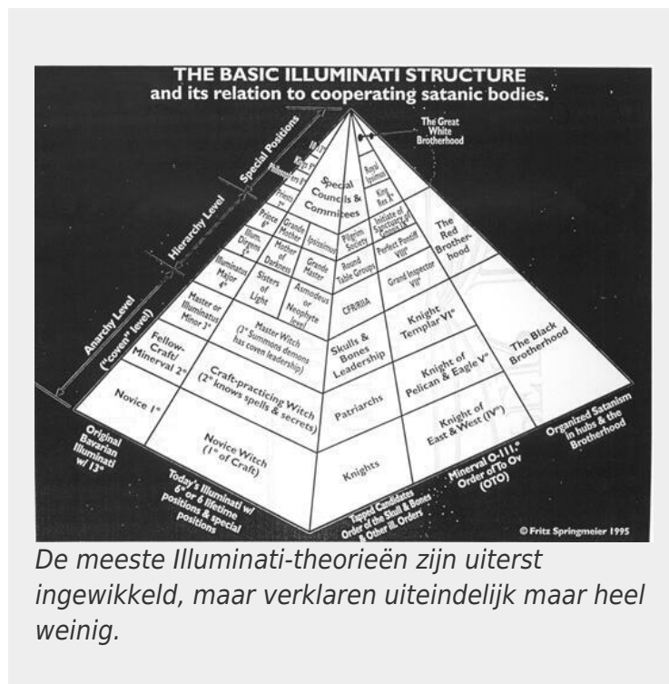
De meeste Illuminati-theorieën zijn uiterst ingewikkeld, maar verklaren uiteindelijk maar heel weinig.

In werkelijkheid is er een overvloed aan bewijs van wat de kapitalistische klasse dagelijks doet. De meeste kapitalistische plannen voor economisch en buitenlands beleid worden openlijk afgedrukt in de pagina's van de *Economist* en de *Wall Street Journal*. We kunnen zien dat ze het er publiekelijk niet mee eens zijn, en we kunnen zien dat hun plannen soms niet lukken. Zeker, er zijn geheimen, maar zoals Wikileaks en Edward Snowden laten zien, kunnen zelfs die ontmaskerd worden door moedige mensen die bereid zijn actie te ondernemen. En de meeste van hun geheimen zijn eigenlijk "open geheimen": informatie is beschikbaar in openbare bibliotheken en op websites, maar de mensen worden zo overweldigd door de hoeveelheid beschikbare informatie dat we geen tijd of energie hebben om uit te zoeken wat belangrijk is.