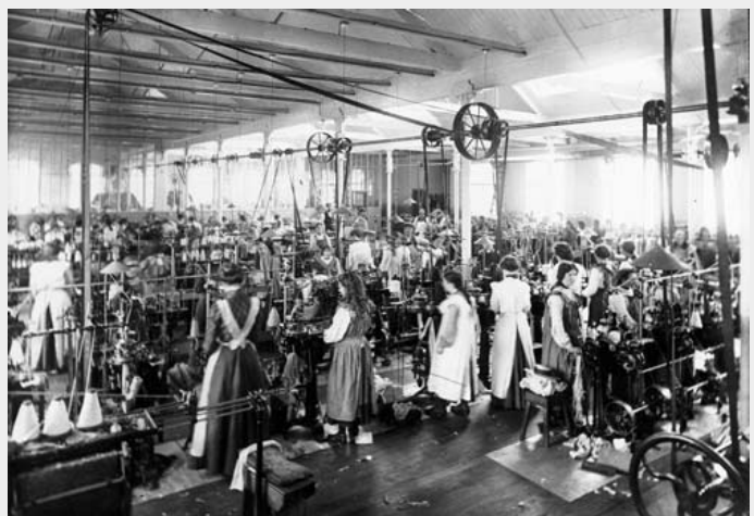
i n de industriële revolutie was uitputtend, onveilig,

Toen het kapitalisme zich ontwikkelde, werden miljoenen mensen van het land verdreven, en gedwongen voor armoedelonen te werken in de nieuwe fabrieken van industrieel Europa. Omdat Joden al geïdentificeerd werden met geld en krediet, begonnen verschillende groepen Joden te zien als een symbool van het kapitalisme zelf. Veel Europese arbeiders geloofden dat Joden hun rol als geldschieters gebruikten om macht te verwerven en mensen uit te buiten. Joden vormden ook een gemakkelijke zondebok voor de petit-bourgeoisie: eigenaren van kleine bedrijfjes die grote fabriekseigenaren probeerden te worden. Deze klasse nam de schulden kwalijk die ze moesten aangaan om hun bedrijf uit te