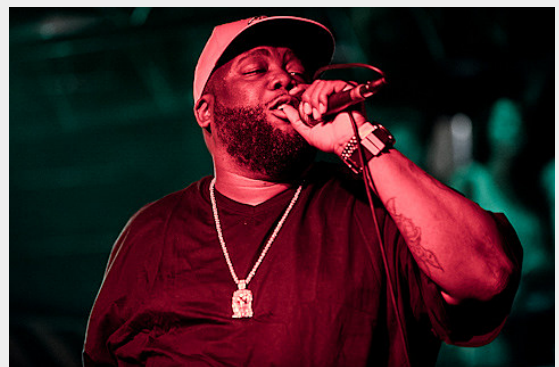
Na de moord op Tryvon Martin in 2012 riep Killer Mike zwarte mensen op zich te bewapenen in geval van een milieucrisis of het einde van de Maya-kalender.