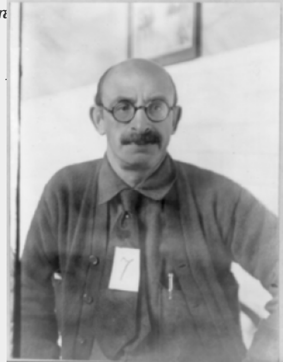
de VS, 1919