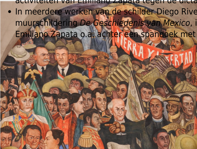
Zapata in een muurschildering van Diego Rivera, Mexico City, 1929-1935.