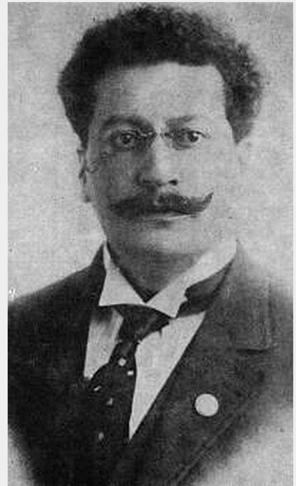
Ricardo Flores Magón

De post-revolutionaire regeringen hebben gepoogd de erfenis van Zapata te incorporeren, en de uit de revolutie voortgekomen Institutioneel Revolutionaire Partij (PRI) beschouwde zichzelf in haar