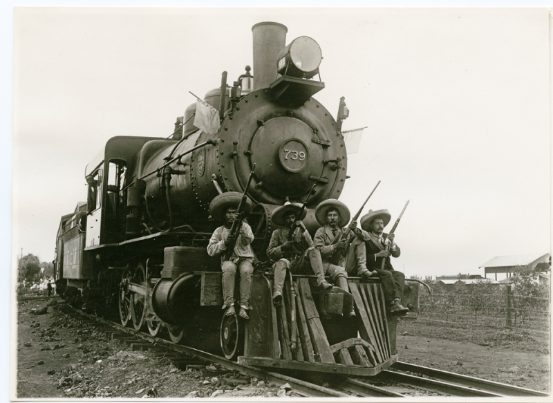
Zapatistische strijders voor een trein, 1911

alweer hervat. In zijn laatste dagen zou Madero dit een van de meest tragische gebeurtenissen uit de Mexicaanse geschiedenis noemen.