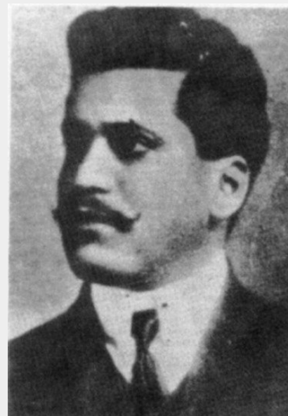
Enrique Flores Magón op jongere leeftijd

Enrique Flores Magón (13 april 1877 - 28 oktober 1954) was een journalist en anarchist uit Mexico en voorvechter van het anarchisme in Mexico tijdens de Mexicaanse Revolutie van 1910. Enrique was samen met zijn broer Ricardo Flores Magón medeoprichter van Partido Liberal Mexicano (PLM, vert. Mexicaanse Liberale Partij) welke, in tegenstelling tot was de naam suggereert, zich als als een anarchistische partij profileerde. De filosofie die Enrique en Ricardo Flores Magón inwikkelde werd ook wel Magonisme genoemd en legde een verband tussen anarcho-communistische ideeën over wederkerig dienstbetoon van Peter Kropotkin en lokale inheemse en agrarische bewegingen.