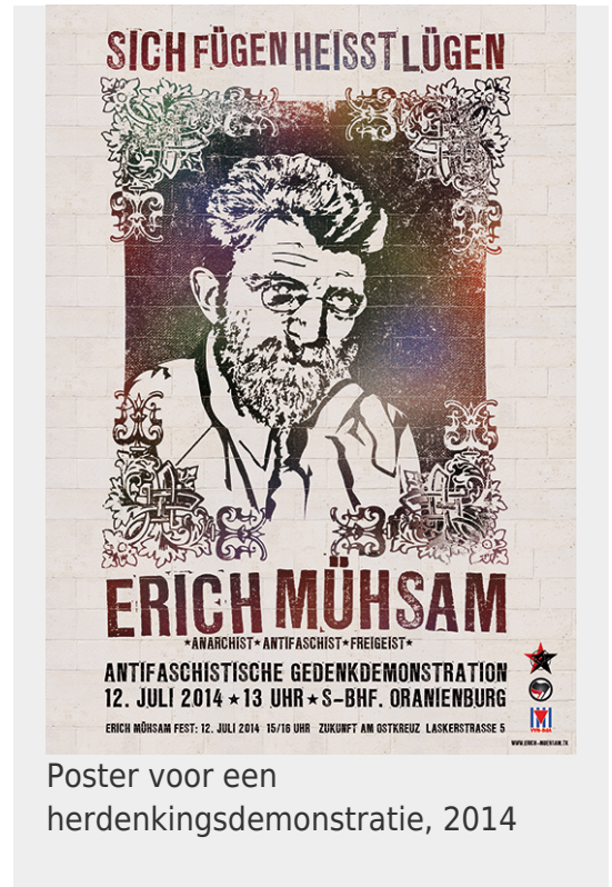
Poster voor een herdenkingsdemonstratie, 2014