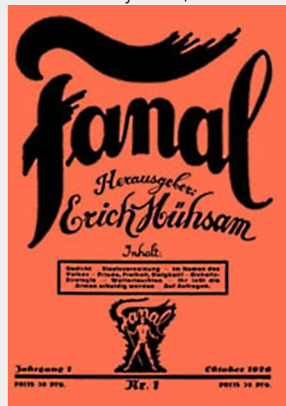
Eerste uitgave van Fanal , 1926