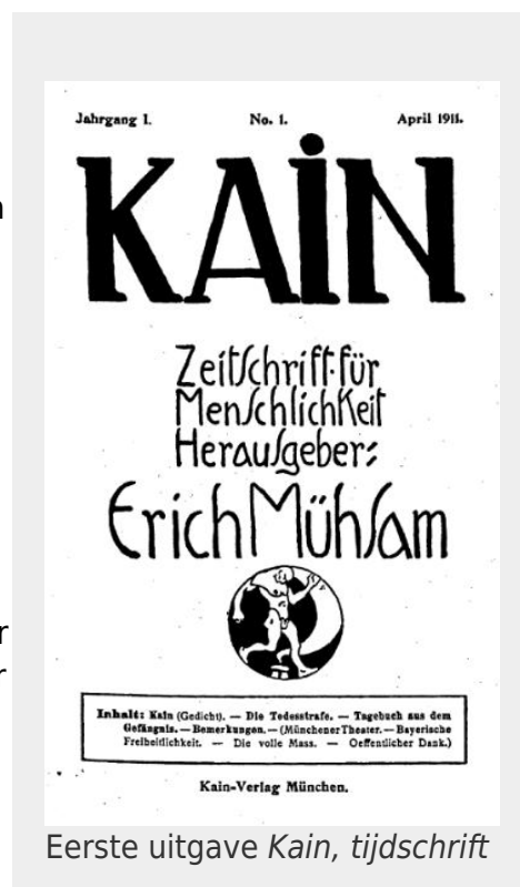
Eerste uitgave Kain , tijdschrift

In München richtte hij de groepering Gruppe Tat mee op, om te agiteren voor het anarchisme. Daarop werd Mühsam in 1910 gearresteerd op verdenking van samenzwering, waarvan hij echter werd vrijgesproken. Mühsam ondervond echter moeilijkheden door de boycot van de pers tegen hem en zijn werk. Hierop richtte Mühsam in 1911 het blad Kain. Zeitschrift für Menschlichkeit op, dat tot 1919 verscheen. Hij werd nu een centrale figuur in de Schwabinger Bohème en raakte bevriend met Heinrich Mann,