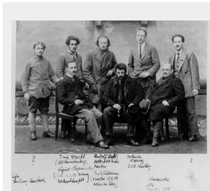
Mühsam (midden voorste rij) met leden van de Radenrepubliek van München in gevangenschap, 1920.