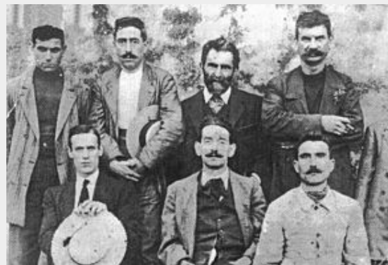
Errico Malatesta (achterste rij, tweede van rechts) samen met strijders van de Arditi del Popolo , in 1921 opgericht als

In 1913 keert Malatesta terug in Italië, geeft daar de Volontà uit in Ancona, maar de uitbraak van de Eerste Wereldoorlog dwingt hem om terug te keren naar