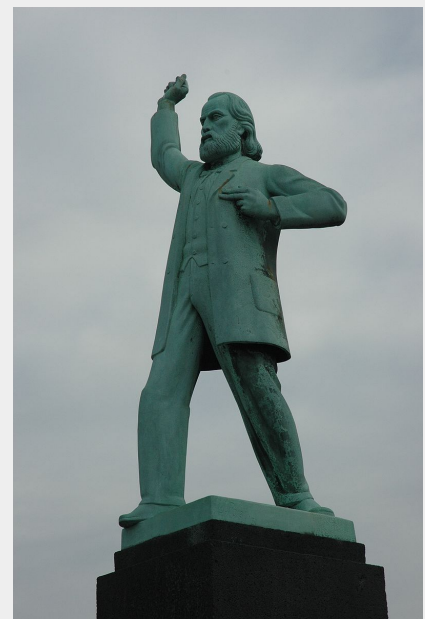
Standbeeld van Domela Nieuwenhuis aan het Nassauplein te Amsterdam.

Op 18 november 1919 overleed Ferdinand Domela Nieuwenhuis op 72-jarige leeftijd te Hilversum. Als één van de eerste Nederlanders werd hij op begraafplaats 'Westerveld', bij Driehuis, gecremeerd. Zijn uitvaart was een indrukwekkende gebeurtenis waarbij 12.000 mensen uit heel het land eerden hem in de rouwstoet.