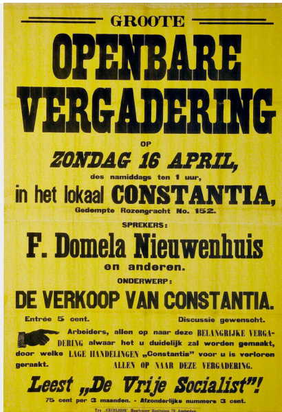
Affiche Openbare Vergadering, 1899