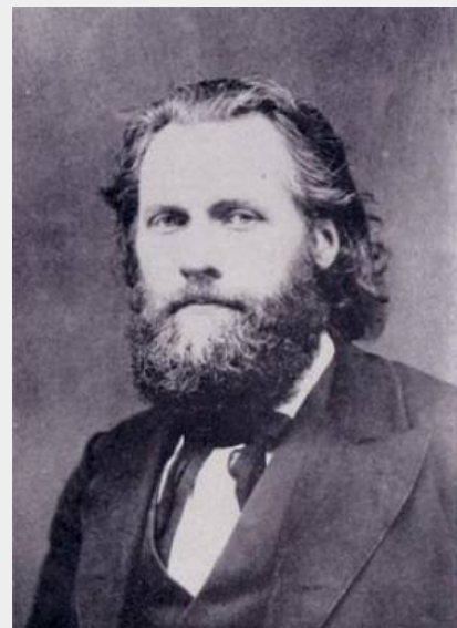
Portret Ferdinand Domela Nieuwenhuis

Ferdinand Domela Nieuwenhuis (Amsterdam, 31 december 1846 - Hilversum, 18 november 1919) was een Nederlands politicus, sociaal-anarchist, en antimilitarist. Domela Nieuwenhuis geldt als een van de oprichters van de socialistische en anarchistische beweging in Nederland. Tevens was hij de oprichter van het tijdschrift De Vrije Socialist .