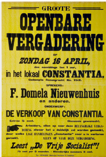
Affiche Openbare Vergadering, 1899