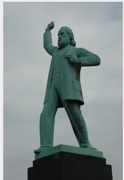
Standbeeld van Domela Nieuwenhuis aan het Nassauplein te Amsterdam.

Op 18 november 1919 overleed Ferdinand Domela Nieuwenhuis op 72-jarige leeftijd te Hilversum. Als één van de eerste Nederlanders werd hij op begraafplaats 'Westerveld', bij Driehuis, gecremeerd. Zijn uitvaart was een indrukwekkende gebeurtenis waarbij 12.000 mensen uit heel het land eerden hem in de rouwstoet.