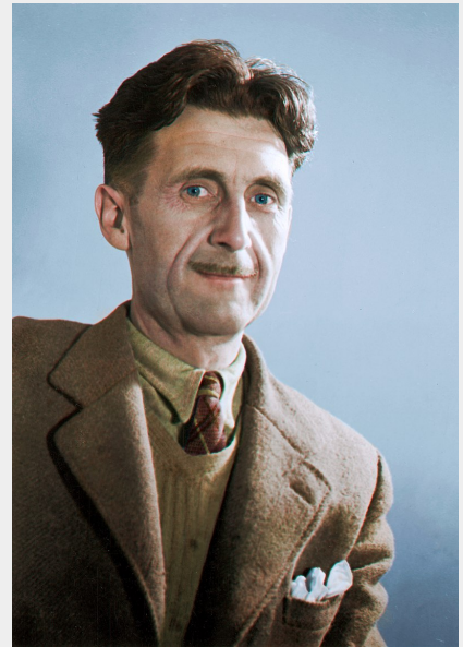
Eric Arthur Blair (George Orwell), ca. 1940 (digitaal ingekleurd)

Eric Arthur Blair (Motihari (India), 25 juni 1903 – Londen, 21 januari 1950 Londen) schreef onder het pseudoniem George Orwell en is onder die naam vooral bekend. Hij was een Brits schrijver, journalist, essayist, literair criticus en een van de meest bewonderde Engelstalige auteurs van de 20e eeuw. Orwell was tijdens de Spaanse Burgeroorlog en Revolutie als vrijwilliger actief voor de POUM en vocht aan het front. Zijn drie bekendst werken schreef hij tegen het einde van zijn leven: zijn Hommage aan Catalonië , de moderne allegorie Animal Farm en de dystopische roman 1984 . Allen zijn scherpe aanklachten tegen stalinisme en totalitarisme en in Hommage aan Catalonië verwerkt hij zijn ervaringen tijdens de Spaanse Burgeroorlog en Revolutie.