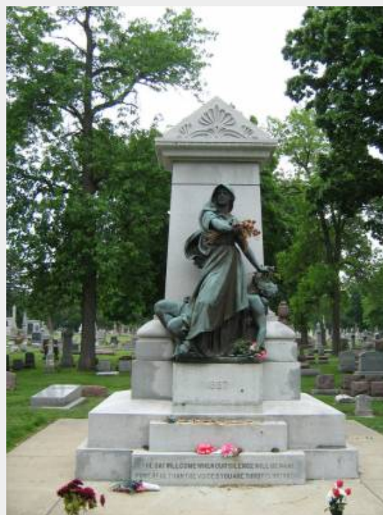
Het monument ter nagedachtenis van de Haymarket martelaren.

Ondanks massaal protest en de vele petitieën kregen slechts twee van de veroordeelden gratie, maar bleven gevangenen. Louis Lingg, een 21-jarige timmerman blies zichzelf, één dag voor het ten uitvoering brengen van het vonnis, op in zijn cel. Albert Parsons, een 39-jarige drukker, August Spies, een 31-jarige stoffeerder, Adolph Fischer (28) en George Engel (51) werden op 11 november 1887 opgehangen. Spies' laatste woorden zijn vereeuwigd in het monument dat later opgericht werd ter herdenking van 'de martelaren van Chicago': "De dag zal komen dat ons zwijgen sterker zal zijn dan alle stemmen die vandaag verstikt worden." Enkele dagen later was de begrafenis die door 25.000 mensen bijgewoond werd. Wereldwijd was de verontwaardiging groot. Er waren bijeenkomsten in Nederland en veel andere landen in Europa. In 1893 verscheen er een officiële verklaring waarin het gehele proces veroordeeld werd en de onschuld van de acht beklagden bevestigd werd.[3]