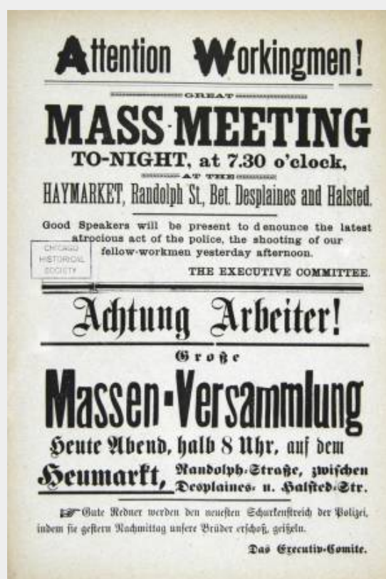
Het pamflet dat oproept tot de stakingsbijeenkomst.

De staking weet de spoorwegen in Chicago volledig lam te leggen en het lukt de stakers bijna de gehele industriële productie van de stad tot stilstand te brengen. Dagelijks worden er betogingen en bijeenkomsten gehouden door werkers en hun sympathisanten. Vrijwel direct na aanvang van de stakingen had zich ook een zogenaamd 'burgercomité' gevormd. Hierin namen grootindustriëlen en de rijke burgerij plaats. Zij zagen hun directe financiële en politieke belangen in het geding komen door de staking en de eisen van de werkers. Het was hun taak om strategieën uit te werken die de staking zouden moeten