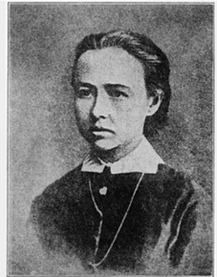
Sophia Perovskaya, lid van Narodnaya Volya

Het deel van de anarchistische beweging dat het werk binnen de vakbonden niet voor zinvol hield, ontwikkelde een anti-syndicalistische houding. Deze stroming, welke zich vooral in West-Europa ontwikkelde, zag economisch terrorisme en onteigeningen als een middel in de politieke strijd. Het 'illegalisme' kwam op, geheime kleine groepen die zich door middel van verboden daden probeerden te verzetten tegen het systeem. De propaganda van de daad was hier een onderdeel van, maar ook anarchistische inbrekersbendes zoals de Bonnot-bende, welke het stelen van geld van de rijken als een manier zagen om het maatschappelijke onrecht te nivelleren. Een groot deel van deze daden waren bedoeld als een expliciet voorbeeld en een uitnodiging aan de maatschappij om mee te doen in deze opstand.[6] Toch stak er er ook een bepaalde politieke wanhoop in de acties, en de acties keerden zich soms ook niet meer enkel tegen de representanten van de macht, maar tegen de maatschappij in het geheel omdat deze zich onverschillig hield tegenover het onrecht in de