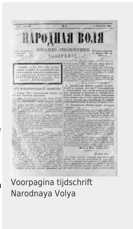
Voorpagina tijdschrift Narodnaya Volya

Narodnaya Volya was de politieke opvolger van de Narodniki en de organisatie had in diens programma een mix van socialistische en democratische eisen. Narodnaya Volya eiste het bijeenroepen van een algemene vergadering voor het opstellen van een grondwet, het invoeren van een algemeen kiesrecht, permanente representatie van het volk, vrijheid van meningsuiting, vrijheid van de pers, vrijheid op vergadering en radicalere eisen als lokaal zelfbestuur, het vervangen van het staande leger door een leger van vrijwilligers uit het volk, het overhevelen van grond naar het