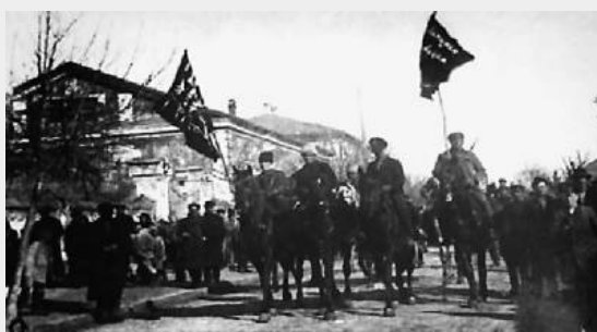
an de Makhnovshchina

Doorheen de maand februari werd het gebied van de Makhnovshchina (dat ondertussen bekend stond als het "vrije territorium" van Oekraïne) overspoeld door Rode troepen. Hieronder bevonden zich de 42ste divisie en de Letse en Estonische divisie die samen met de andere rode eenheden minstens 20,000 soldaten telde.