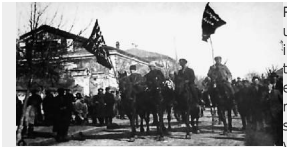
an de Makhnovshchina

R leger die zich in 1920 overgaf aan Makhno. Viktor Belash u schreef hierover: “zelfs tijdens de zware periodes van i 1920 (aan het begin van het jaar) bleef het t revolutionaire leger de gevangengenomen gewone e soldaten van het Rode leger in vrijheid stellen.