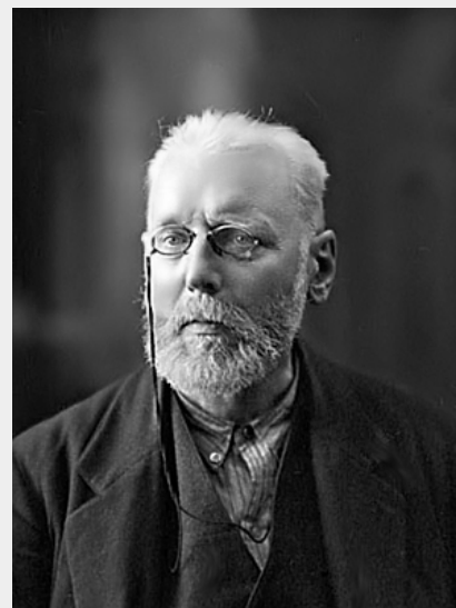
Max Nettlau, Barcelona 1928

Max Heinrich Hermann Reinhardt Nettlau (Wenen, 30 april 1865 - Amsterdam, 23 juli 1944) was een taalwetenschapper en anarchistisch historicus uit Oostenrijk. Hij was een zeer belangrijk Duitstalig geschiedschrijver voor de anarchistische beweging en was de laatste jaren van zijn leven zeer actief in het Internationale Instituut voor Sociale Geschiedenis (IISG) in Amsterdam.