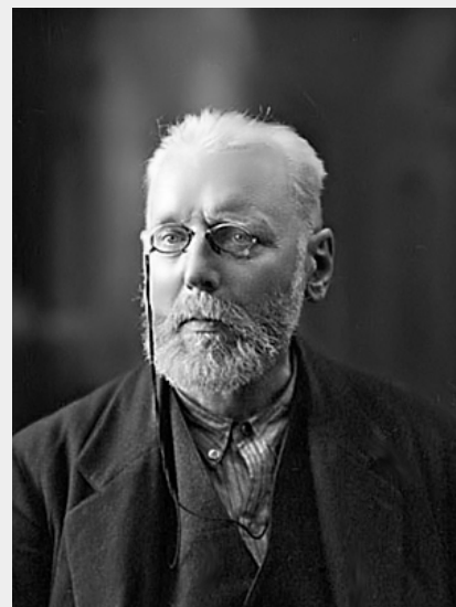
Max Nettlau, Barcelona 1928

Max Heinrich Hermann Reinhardt Nettlau (Wenen, 30 april 1865 - Amsterdam, 23 juli 1944) was een taalwetenschapper en anarchistisch historicus uit Oostenrijk. Hij was een zeer belangrijk Duitstalig geschiedschrijver voor de anarchistische beweging en was de laatste jaren van zijn leven zeer actief in het Internationale Instituut voor Sociale Geschiedenis (IISG) in Amsterdam.