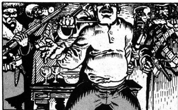
NESTOR MAKHNO VERZAMELDE EEN GUERRILLALEGER EN VIEL DE DOOR DE DUITSCERS GESTEUDE LANDEIGENAREN LASTIG. HIJ GEBRUIKTE HIERBIJ VAAK VIJANDELIJKE VERMOMMINGEN OM EERST HUN GASTVRIJHEID TE VERKRIJGEN.