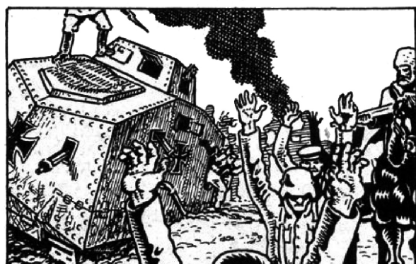
UITEINDELIJK VERSLOEG HIJ EEN DUITSE DIVISIE, DIE GESTUURD WAS OM HEM TE ONDERWERPEN. HIJ TROK NAAR HET NOORDEN EN VERVING DE BOLSJEWISTISCHE COMMISSARISSSEN DOOR LIBERTAIRE (ANARCHISTISCHE) COMMUNES.