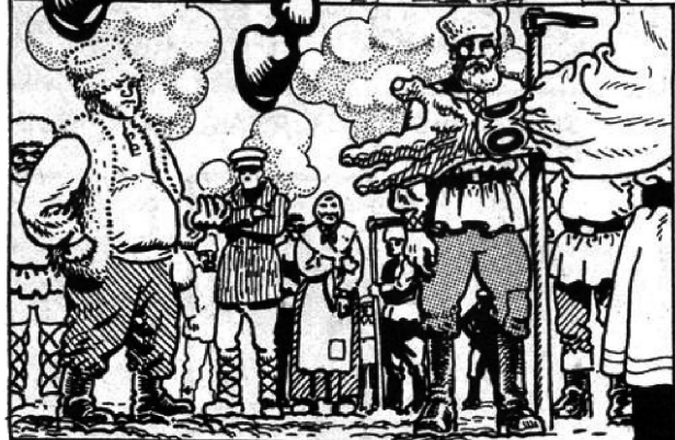
VAN BREST-LITOVSK WAS AFGESTAAN, VERKLAARDE DE NABAT-CONFEDERATIE ZIJN ONAFHANKELIJKHEID EN VERDEELDE HET DE LANDELIJEN ONDER DE BOEREN.