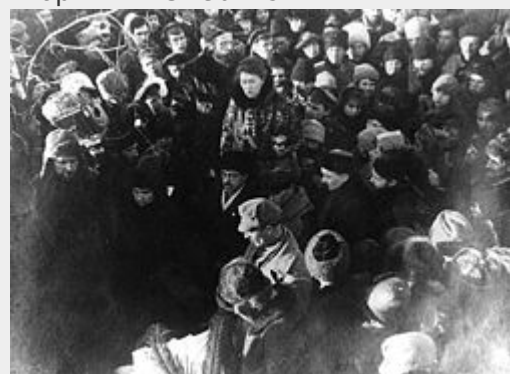
De laatste massademonstratie van anarchisten tijdens de begrafenis van Kropotkin - 13 feb. 1921.