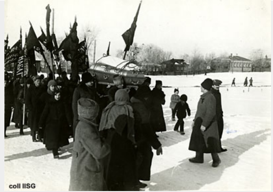
De laatste massademonstratie van anarchisten tijdens de begrafenis van Kropotkin - 13 feb. 1921.

Op 8 februari 1921 stierf hij en op 13 februari vond de begrafenis plaats. Alfred Rosmer, zeker geen kritiekloos bewonderaar van Kropotkin, die namens de Rode Vakverenigings Internationale op het kerkhof sprak, schrijft in Moscou sous Lénine: "De zwarte vlaggen zwaaiden door de lucht en er werden ontroerende liederen gezongen. Op het kerkhof ontstond er een kort maar heftig incident tijdens de eerste redevoeringen. Een Petrogradse anarchist was al enige tijd aan het spreken, toen er gedempte maar verhitte protestuitingen kwamen - 'Dovolno! Dovolno!' (Genoeg! Genoeg!). Op deze rouwdag wilden Kropotkin's intiemste vrienden niet herinnerd worden aan wat de meeste, zo niet alle anarchisten wel moesten zien als zijn afvalligheid in 1914."