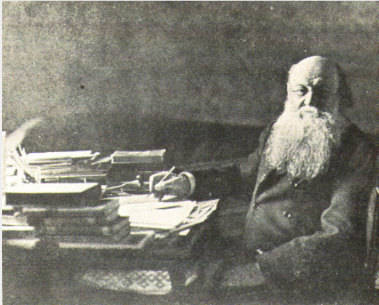
Kropotkin aan zijn bureau.