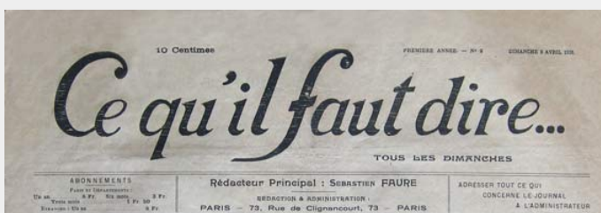
Krantenkop Ce qu'il faut dire , 2 april 1916 (anarchistische krant)

Sébastien Faure kwam uit een katholieke familie uit de middenklasse in Saint-Etienne, nabij Lyon in Frankrijk. Hij genoot een 'goede' opvoeding, liep school bij de Jezuïeten en was voorbestemd om priester te worden. Maar na de vroege dood van zijn vader kwam hij in verzekeringszaken terecht. En na zijn militaire dienst belandde hij voor een jaar in Engeland. Daarna trad hij in het huwelijk en verhuisde hij naar Bordeaux. Spoedig verloor hij zijn religieus geloof en hij werd socialist. In 1885 deed hij in de Gironde mee aan de verkiezingen als kandidaat van de marxistische Parti Ouvrier .