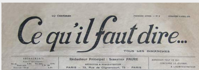
Krantenkop Ce qu'il faut dire , 2 april 1916 (anarchistische krant)

Sébastien Faure kwam uit een katholieke familie uit de middenklasse in Saint-Etienne, nabij Lyon in Frankrijk. Hij genoot een 'goede' opvoeding, liep school bij de Jezuïeten en was voorbestemd om priester te worden. Maar na de vroege dood van zijn vader kwam hij in verzekeringszaken terecht. En na zijn militaire dienst belandde hij voor een jaar in Engeland. Daarna trad hij in het huwelijk en verhuisde hij naar Bordeaux. Spoedig verloor hij zijn religieus geloof en hij werd socialist. In 1885 deed hij in de Gironde mee aan de verkiezingen als kandidaat van de marxistische Parti Ouvrier .