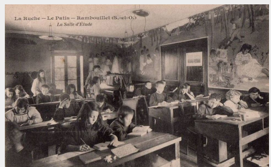
Klaslokaal met leerlingen van de La Ruche -school