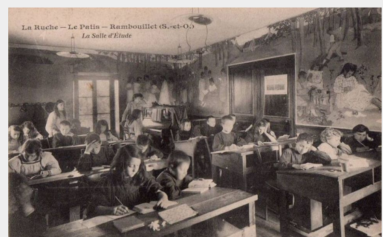
Klaslokaal met leerlingen van de La Ruche -school