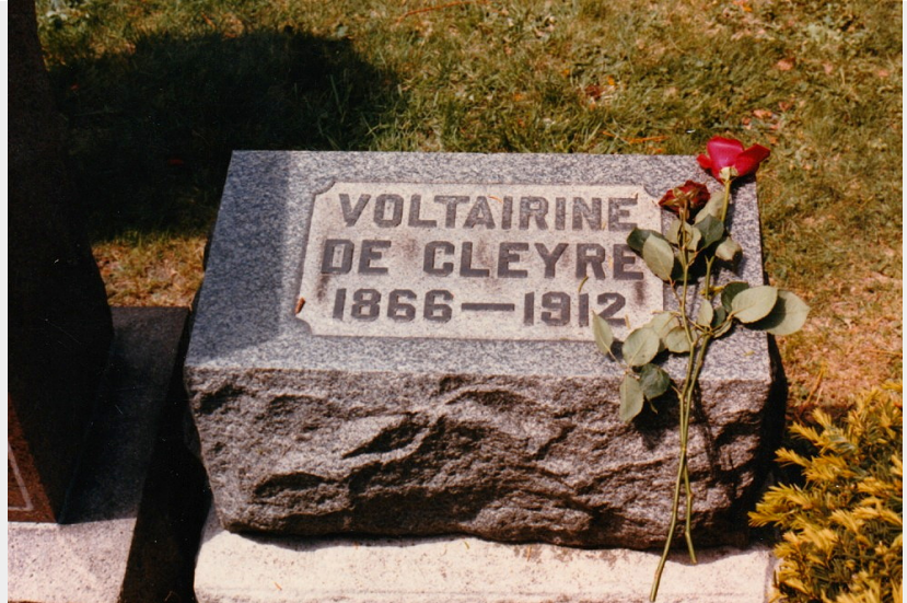
De Cleyres graf op de Waldheim-begraafplaats in Chicago.

de Haymarket-affaire op de Waldheim-begraafplaats.