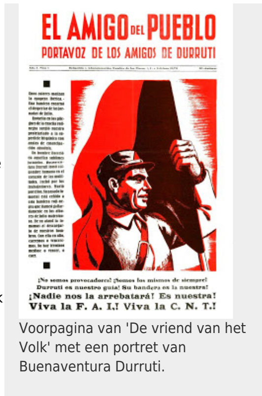
Voorpagina van 'De vriend van het Volk' met een portret van Buenaventura Durruti.

“De anti-fascistische eenheid was uiteindelijk niets anders dan een onderwerping aan de