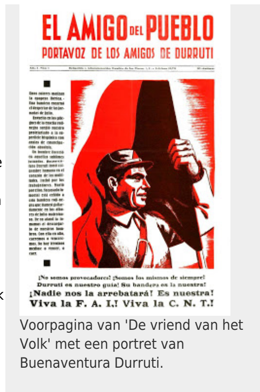
Voorpagina van 'De vriend van het Volk' met een portret van Buenaventura Durruti.

“De anti-fascistische eenheid was uiteindelijk niets anders dan een onderwerping aan de