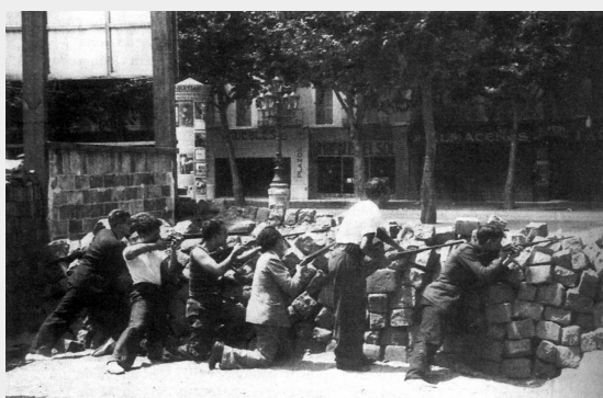
Barricade in Barcelona, mei 1937.

Een acht-punten-programma van de Vriendengroep van Durruti "aan de arbeidersklasse".